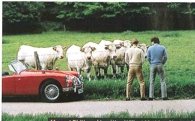
Marc et Philippe (Aurélien Wiik et Mathieu Simonet).

Dans la première partie du film, et même si l'on aurait aimé en savoir un peu plus sur l'environnement politique et social de cette génération d'avant 68, la peinture de mœurs fait mouche, d'autant qu'en refusant d'intellectualiser son propos, François Armanet parvient à cristalliser l'insouciance, voire l'inconséquence de ces dandys. La suite (les boums, les premiers ébats amoureux, les vacances au