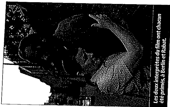
Les deux interprètes du film ont chacun été primés, à Berlin et Rabat.

Le distributeur, Tadrart Films, table surtout sur la notoriété de Rachid Bouchareb pour vendre le film aux exploitants et attirer le public. «Le réalisateur a désiré, après Indigènes et avant sa prochaine « grosse » production, Hors-la-loi, tourner un film avec une équipe légère. Le projet était plus simple et rapide à monter avec Arte, car il nécessitait peu de moyen et pouvait être fait rapidement. Cela n'enlève rien à sa qualité», précise la distributrice. Son