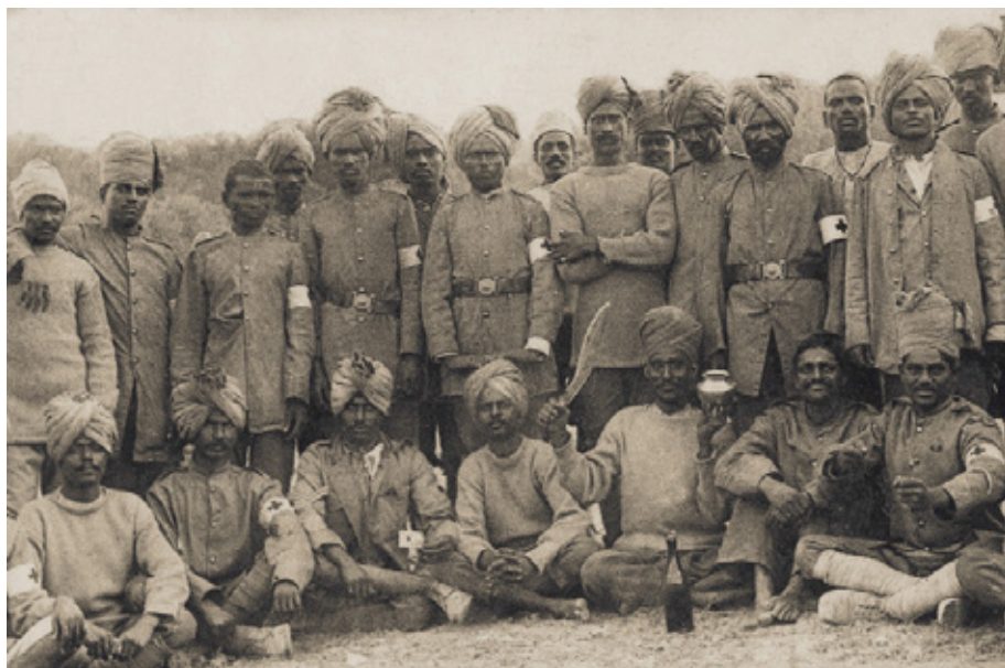
Groupe d'Hindous campés à Marseille , carte postale 1915