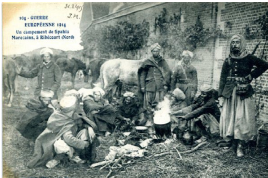
Un campement de Spahis marocains à Ribécourt, Nord, carte postale 1914