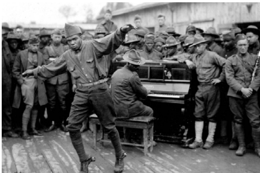
Troupes Afro-Américaines à Bordeaux, photographie 1918