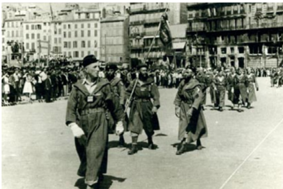
Le colonel Boyer de Latour suivi du fanion du 2 e GTM, lors du défilé des troupes françaises sur le port de Marseille, photographie août 1944