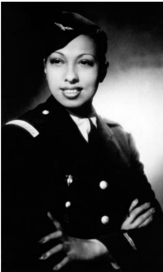
Joséphine Baker, photographie 1945