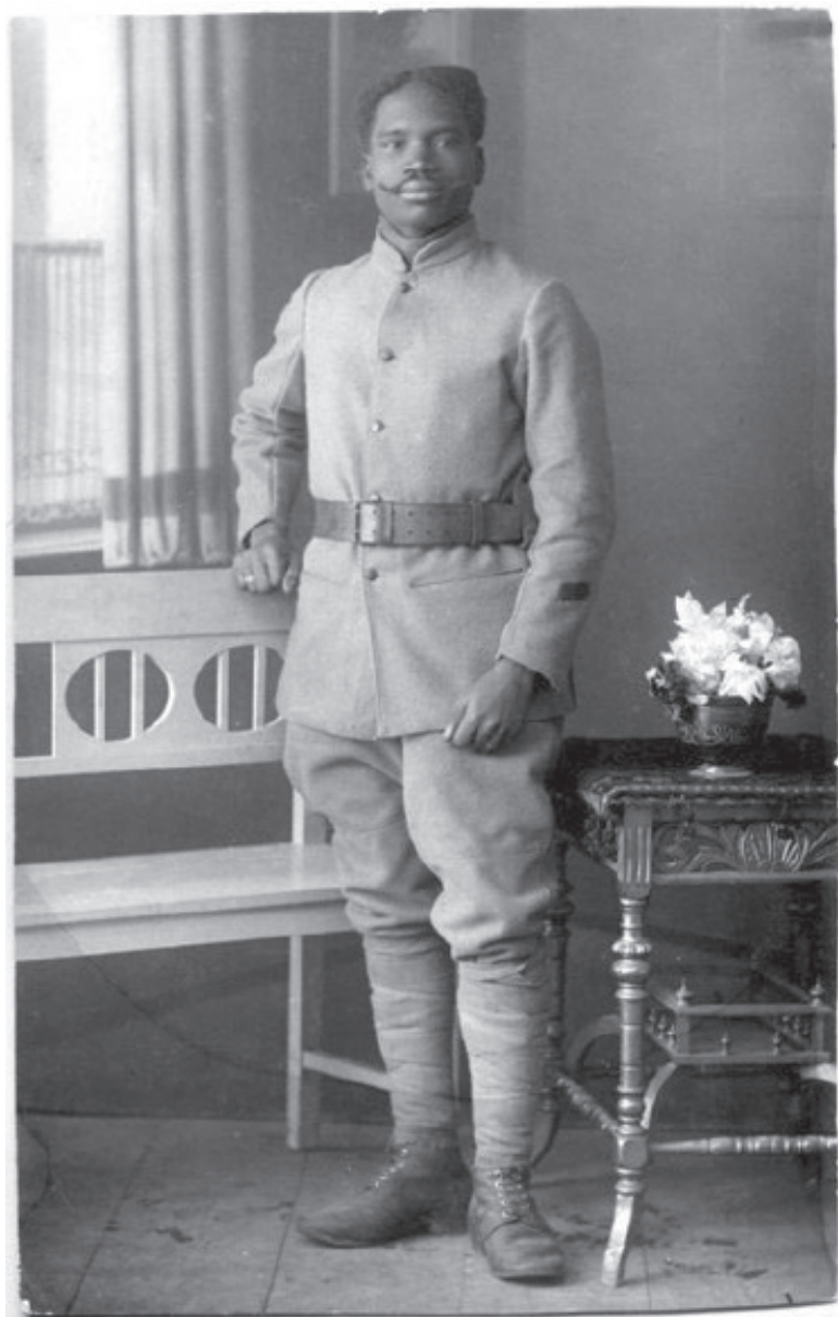
Atelje « Rajsic » Zemun, photographie 1916 © Collection Éric Deroo