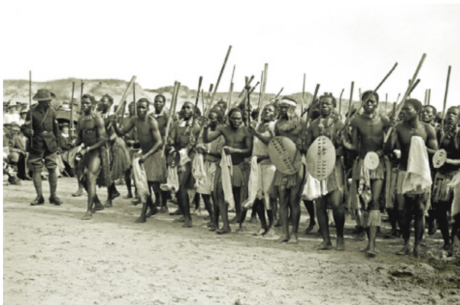
South African Labour in Wancourt , dans le Pas-de-Calais, photographie 1917